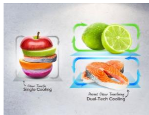
Dual Tech Cooling

L'air froid est distribué de manière homogène dans les colonnes à chaque étage. Les aliments sont refroidis rapidement quel que soit leur emplacement et même si le réfrigérateur est rempli.