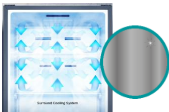
Multi Air Flow+ MetalTech Cooling

L'air froid est distribué de manière homogène dans les colonnes à chaque étage. Les aliments sont refroidis rapidement quel que soit leur emplacement et même si le réfrigérateur est rempli.