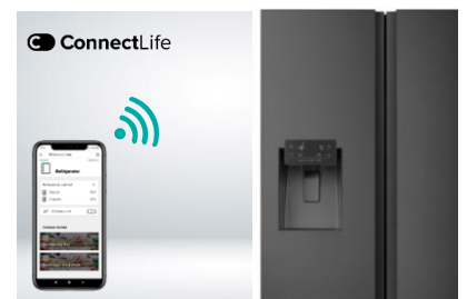
Contrôle à distance (wifi)

Les 2 compartiments sont indépendants l'un de l'autre ce qui empêche les transferts d'odeurs et garanti un niveau d'humidité optimal dans le réfrigérateur.